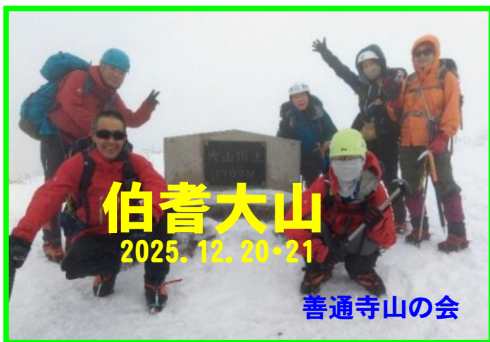
伯耆大山 2025. 12. 20-21

今年の干支は午（うま）で、丙午（ひのえうま）にあたります。馬が力強く駆け抜けるような前向きな一年になるとされています。干支のように、県連と各会・クラブが一致団結して、力を合わせ飛躍の年にしたいと願っています。