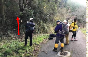
↑は、相草上峠からの登山道