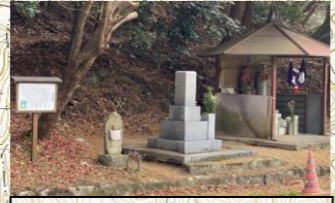
額峠のお地藏さん