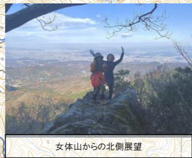
女体山からの北側展望